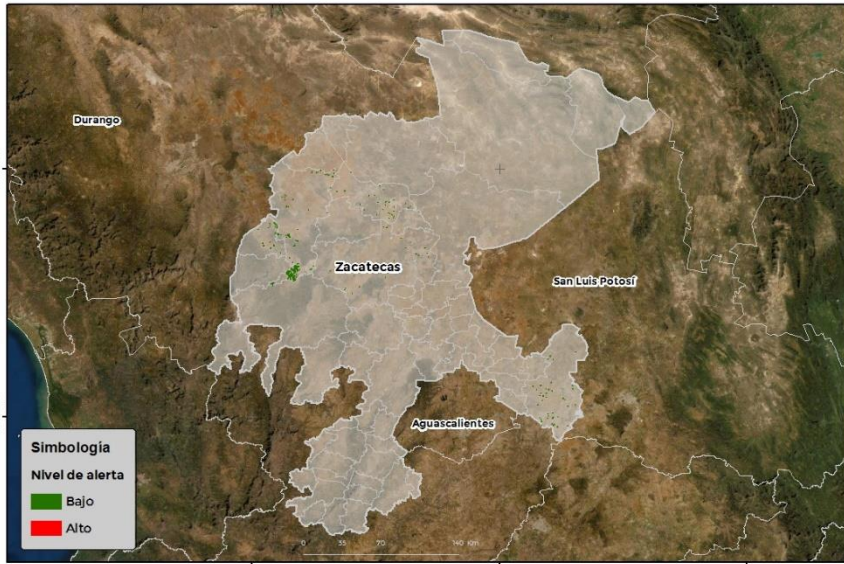
Nivel de alerta por Roya de la hoja del trigo en Zacatecas

Se identifica que la Roya de la hoja del trigo puede iniciar su proceso de infección debido a que existen condiciones favorables en 5 municipios en riesgo fitosanitario bajo (Anexo 1).