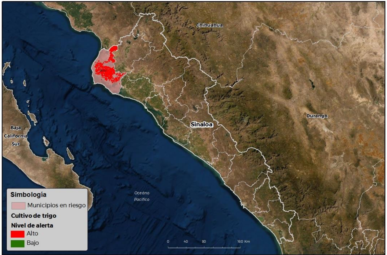
Municipios con cultivo y probable riesgo por Roya de la hoja del trigo en Sinaloa

COORDINADAS: SENASICA © 2021 RCD FECHA: 28-NOV-2021 09:05:20