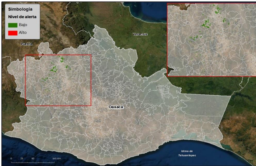
Nivel de alerta por Roya de la hoja del trigo en Oaxaca

Se identifica que la Roya de la hoja del trigo puede iniciar su proceso de infección debido a que hay: