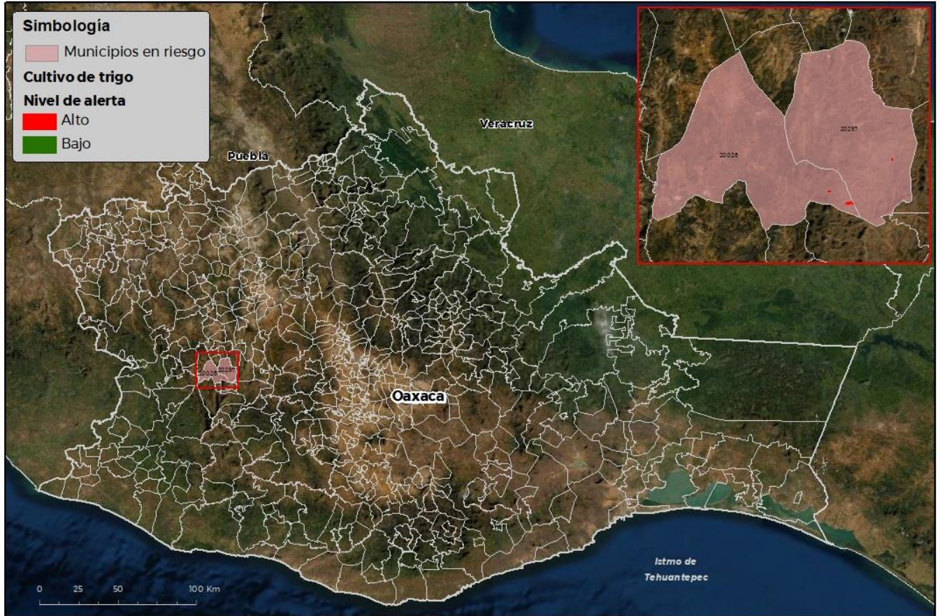
Municipios con cultivo y probable riesgo por Roya de la hoja del trigo en Oaxaca

CEOM ATICA-03-SENASICA © 2021 RCR FECHA: 19-SEPTIEMBRE-2021