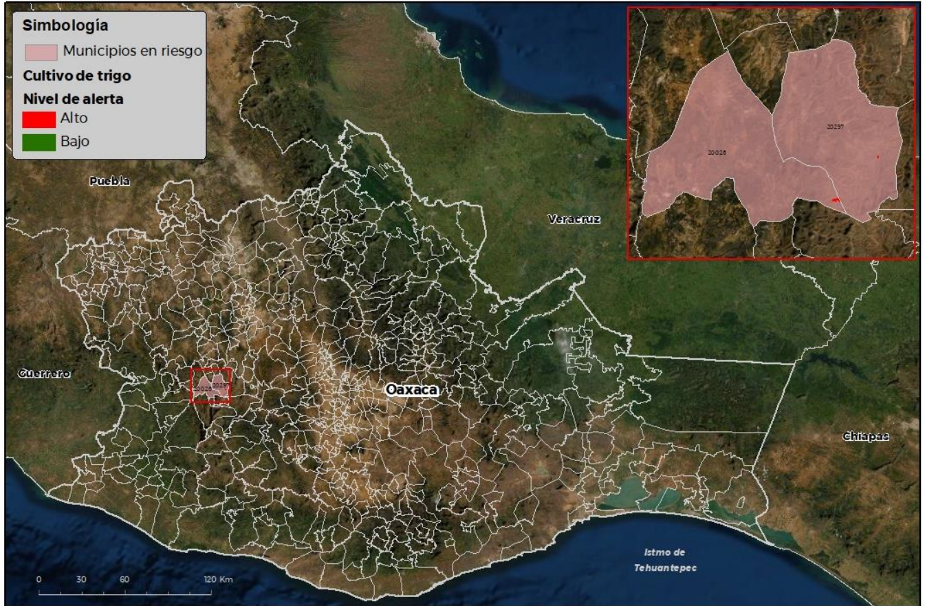
Municipios con cultivo y probable riesgo por Roya de la hoja del trigo en Oaxaca

CEM/ATICA-01/SENASICA © 2021/RCR FECHA: 11-OCTUBRE-2021