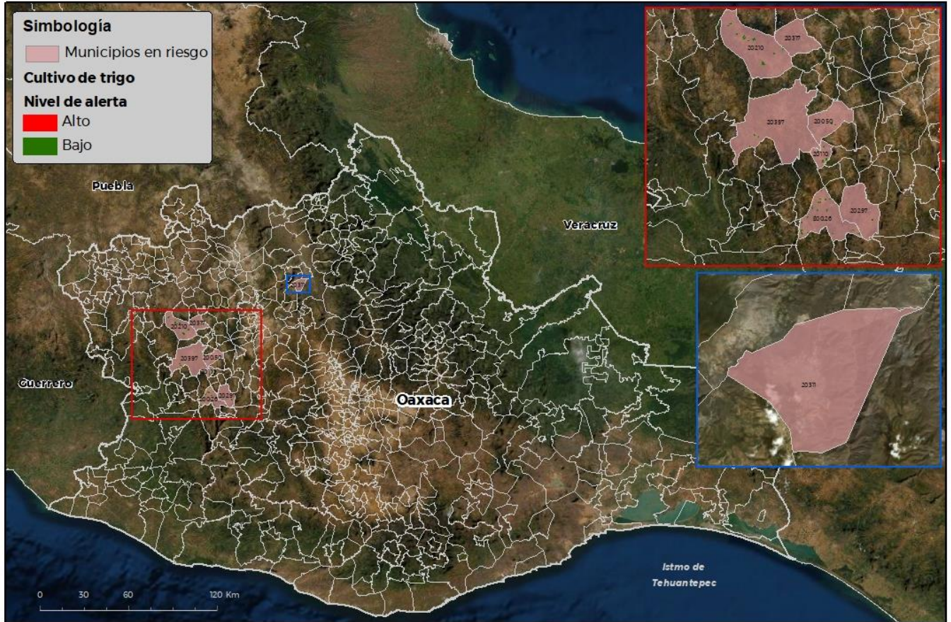
Municipios con cultivo y probable riesgo por Roya de la hoja del trigo en Oaxaca

CEBOM AF-01-SENASICA © 2021 RCR FECHA: 04-OCTUBRE-2021