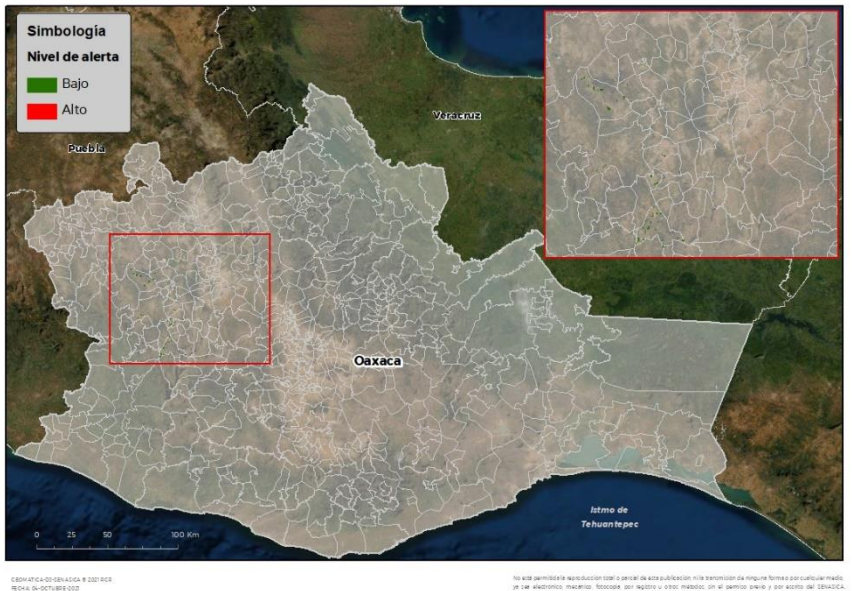
Nivel de alerta por Roya de la hoja del trigo en Oaxaca

Se identifica que la Roya de la hoja del trigo puede iniciar su proceso de infección debido a que existen condiciones favorables en 8 municipios en riesgo fitosanitario bajo (Anexo 1).