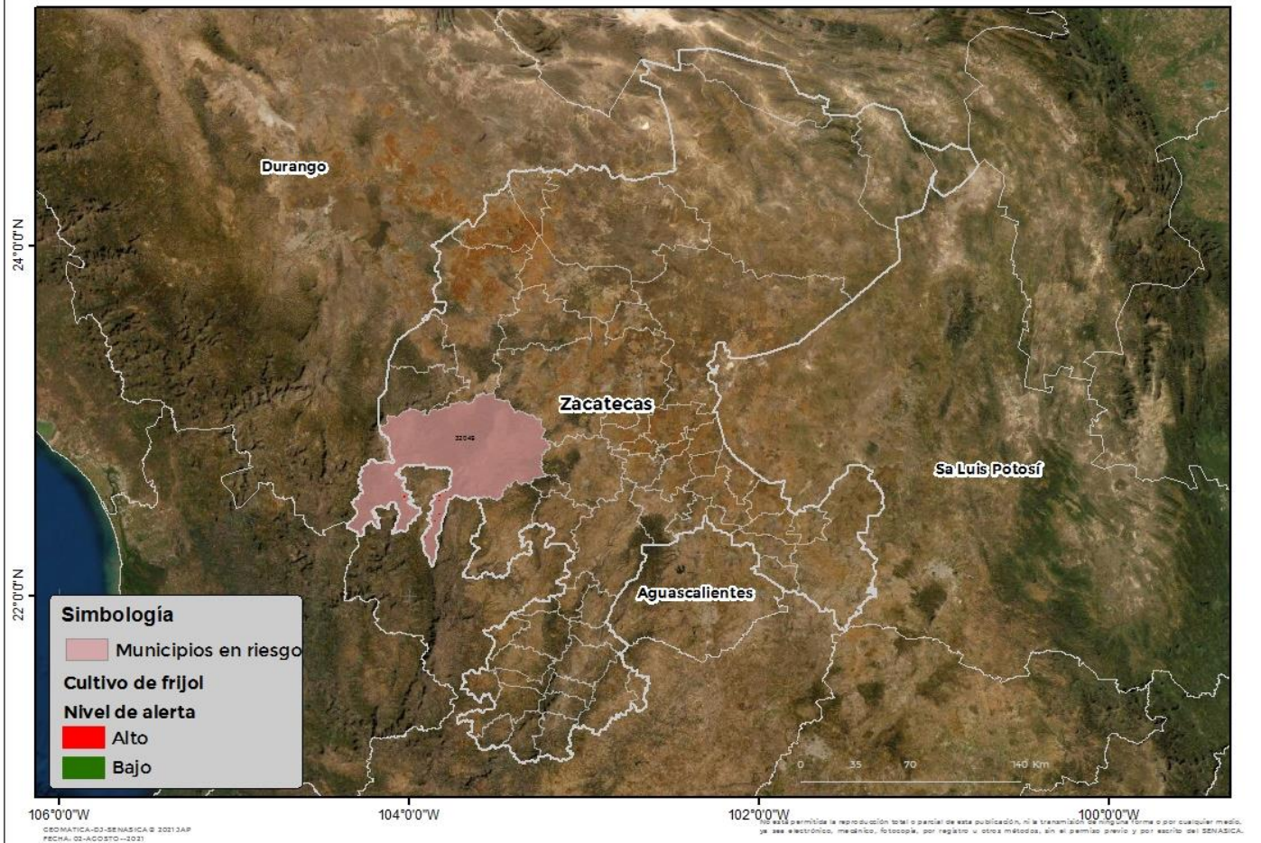
Municipios con cultivo y probable riesgo por Roya del frijol en Zacatecas

Anexo 1.- Se ha identificado 1 municipio con riesgo alto, y presencia del cultivo para el proceso de infección de Roya de frijol, mismo que en caso de presentarse la plaga estaría en riesgo.