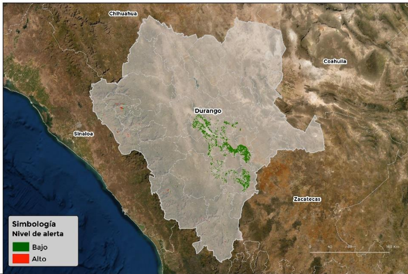
Nivel de alerta por Roya de frijol en Durango

Se identifica que la roya de frijol puede iniciar su proceso de infección debido a que hay: