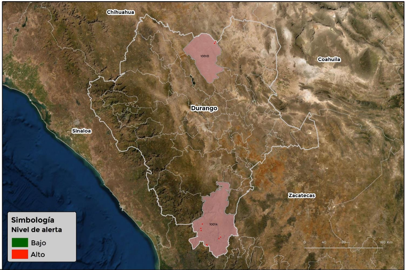
Municipios con cultivo y probable riesgo por Roya del frijol en Durango

Simbología Nivel de alerta ■ Bajo ■ Alto