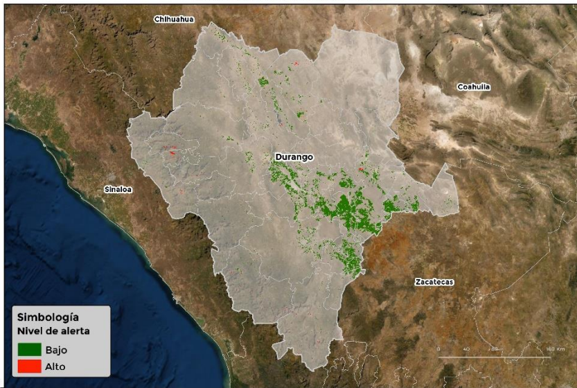
Nivel de alerta por Roya de frijol en Durango

Se identifica que la roya de frijol puede iniciar su proceso de infección debido a que hay: