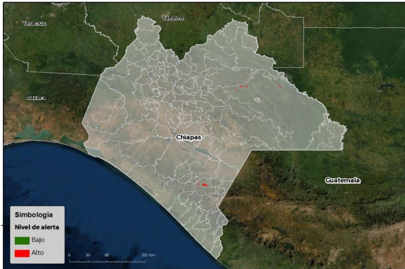
Nivel de alerta por Roya del frijol en Chiapas

Se identifica que la roya de frijol puede iniciar su proceso de infección debido a que hay: