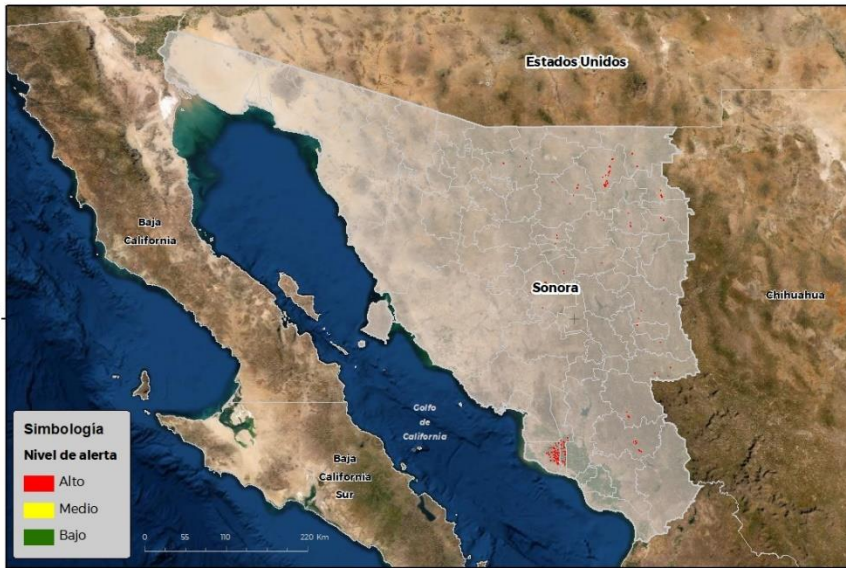
Nivel de alerta por Gusano elotero en Sonora

Se identifica que la plaga puede comenzar su desarrollo debido a que hay: