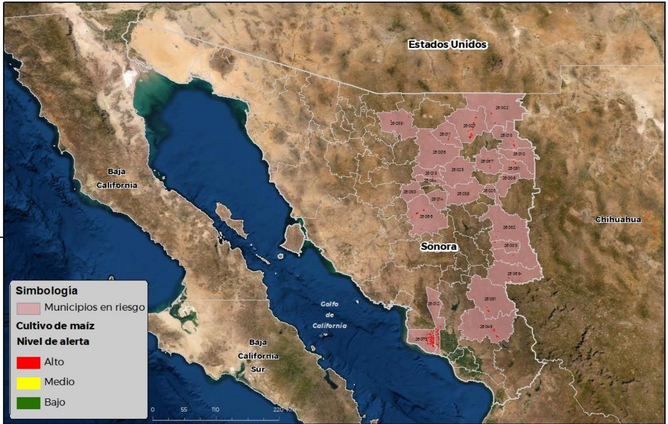
Municipios con cultivo y probable riesgo por Gusano elotero en Sonora

CEBOM AF-ICA-03-SENASICA © 2021 SCS FECHA: 23-SEPTIEMBRE-2021