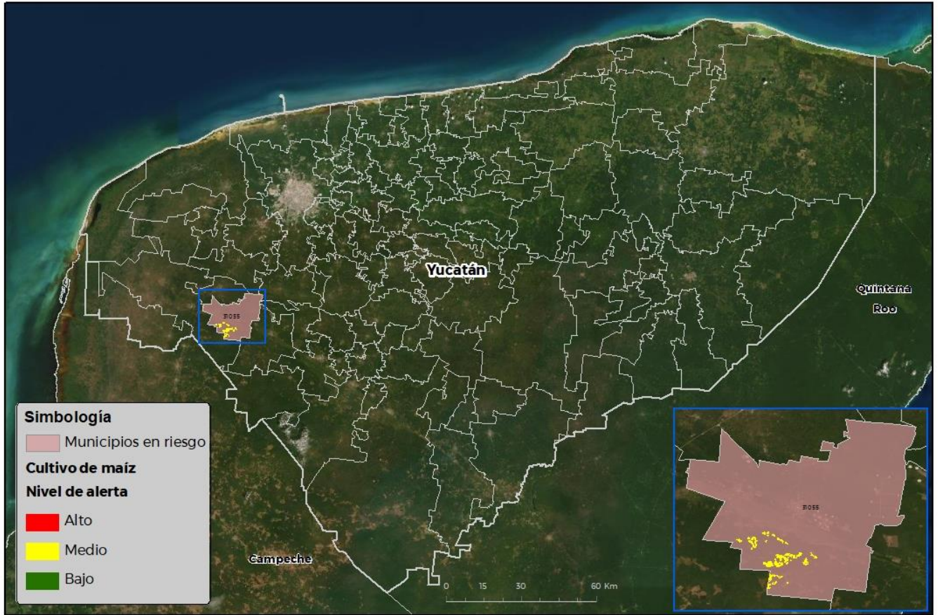
Municipios con cultivo y probable riesgo por Gusano cogollero en Yucatán

FECHA: 11-OCTUBRE-2021