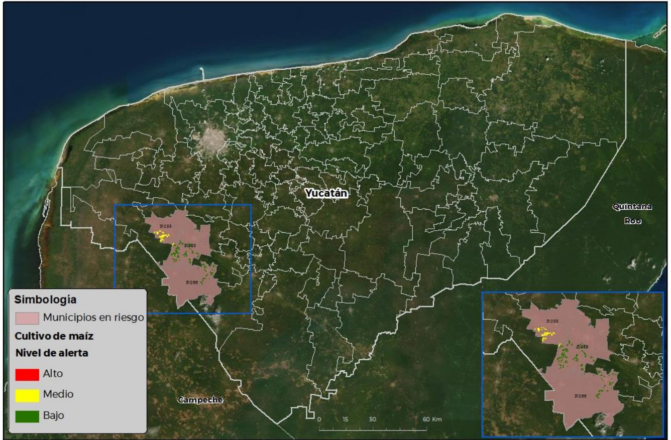
Municipios con cultivo y probable riesgo por Gusano cogollero en Yucatán

© SENASICA-03-SENASICA © 2021 SICR FECHA: 25-NOVIEM-2021