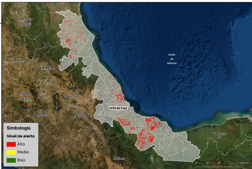
Nivel de alerta por Gusano cogollero en Veracruz

Se identifica que la plaga puede comenzar su desarrollo debido a que hay: