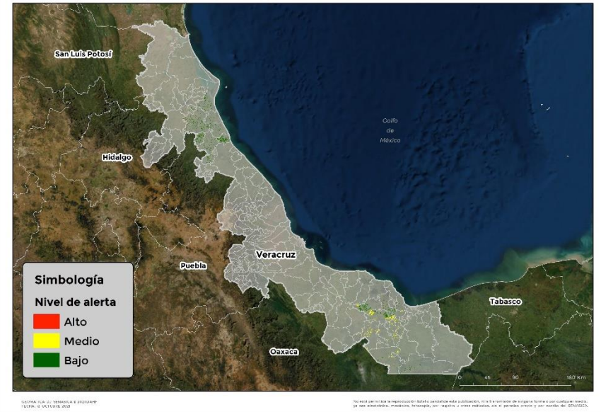
Nivel de alerta por Gusano cogollero en Veracruz

Se identifica que la plaga tiene bajas condiciones para comenzar su desarrollo debido a que se identificaron 18 municipios en riesgo fitosanitario medio y bajo (Anexo 1).