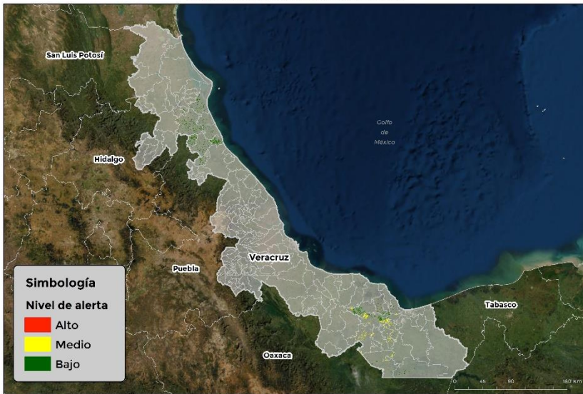
Nivel de alerta por Gusano cogollero en Veracruz

Se identifica que la plaga tiene bajas condiciones para comenzar su desarrollo debido a que se identificaron 18 municipios en riesgo fitosanitario medio y bajo (Anexo 1).