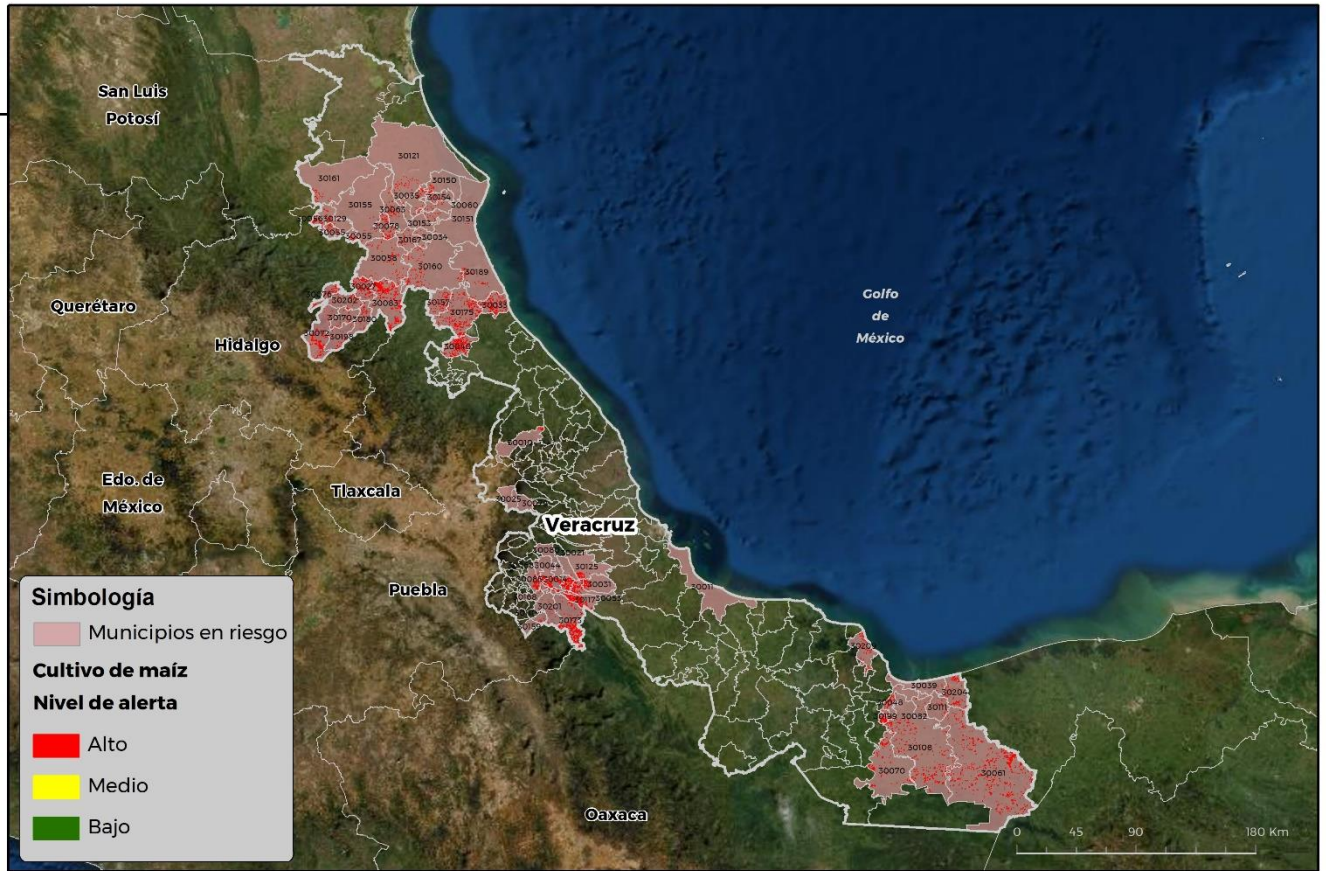
Municipios con cultivo y probable riesgo por Gusano cogollero en Veracruz

GEOMÁTICA-D3-SENASICA © 2021 RGR FECHA: 07-MAYO-2021