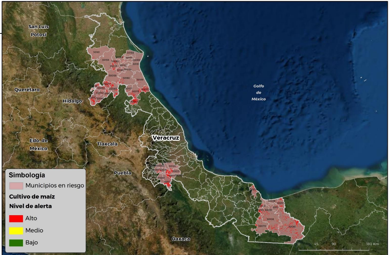
Municipios con cultivo y probable riesgo por Gusano cogollero en Veracruz

GEOMÁTICA-DJ-SENASICA © 2021 RCR FECHA: 29-ABRIL-2021