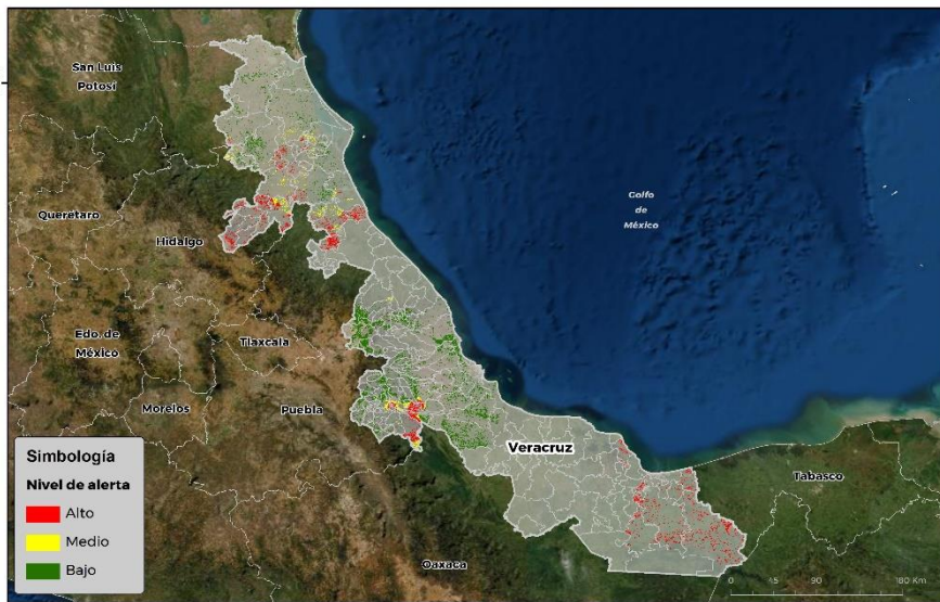
Nivel de alerta por Gusano cogollero en Veracruz

Se identifica que la plaga puede comenzar su desarrollo debido a que hay: