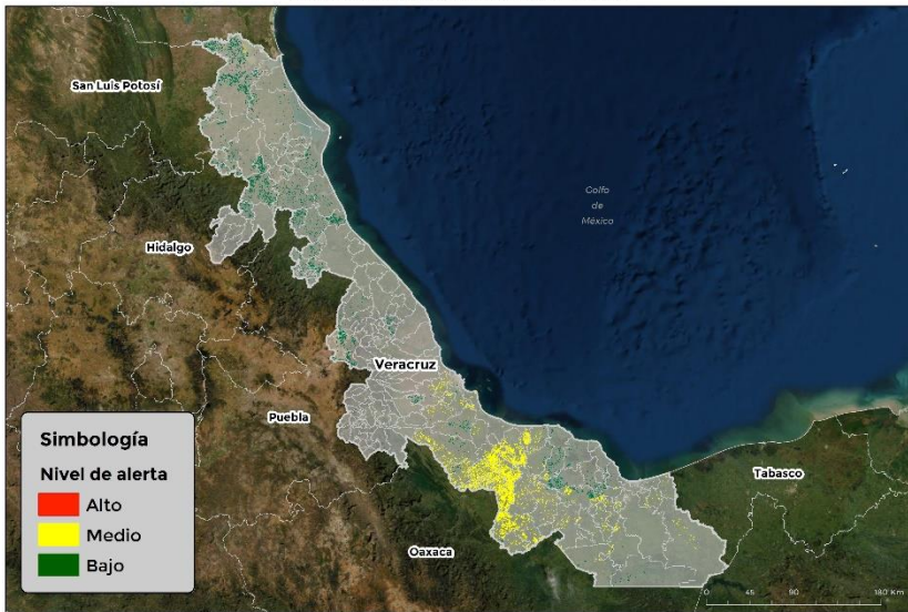
Nivel de alerta por Gusano cogollero en Veracruz

Se identifica que la plaga tiene bajas condiciones para comenzar su desarrollo debido a que se identificaron 103 municipios en riesgo fitosanitario medio y bajo (Anexo 1).