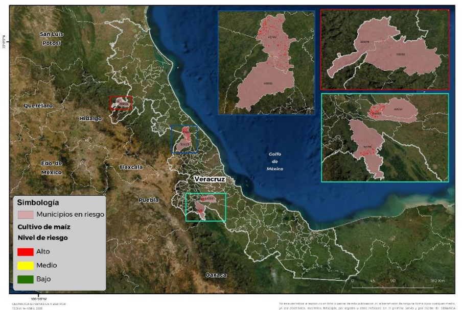
Municipios con cultivo y probable riesgo por Gusano cogollero en Veracruz

Se identifica que la plaga puede comenzar su desarrollo debido a que hay: