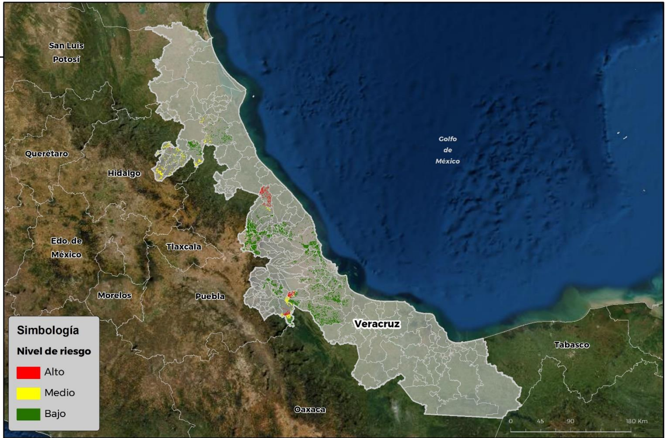
Nivel de alerta de Gusano cogollero en Veracruz

Anexo 1.- Se han identificado 7 municipios con alto riesgo y presencia del cultivo para el desarrollo de Gusano cogollero, mismos que en caso de presentarse la plaga estarían en riesgo.