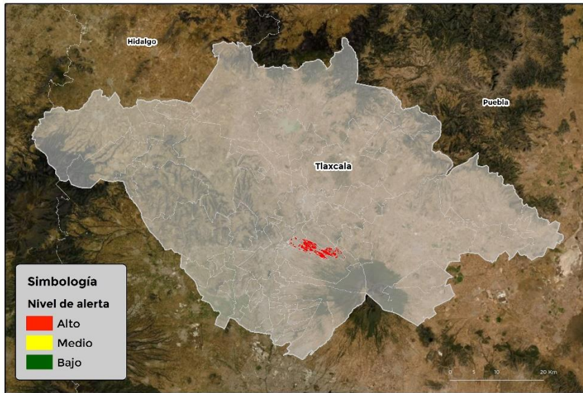
Nivel de alerta por Gusano cogollero en Tlaxcala

Se identifica que la plaga puede comenzar su desarrollo debido a que hay: