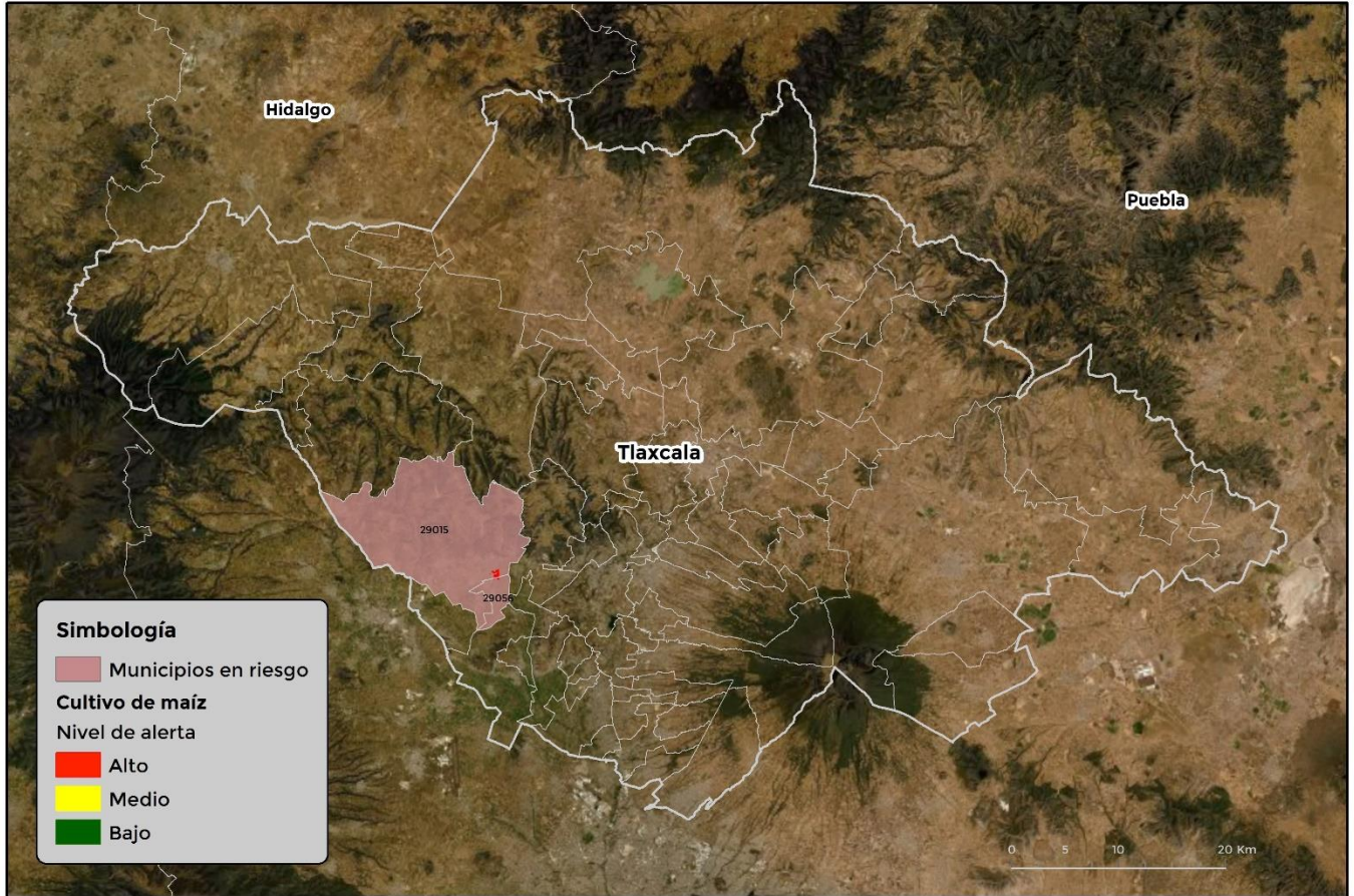
Municipios con cultivo y probable riesgo por Gusano cogollero en Tlaxcala

GEOMÁTICA-D3-SENASICA © 2021 AFC FECHA: 29-ABRIL-2021