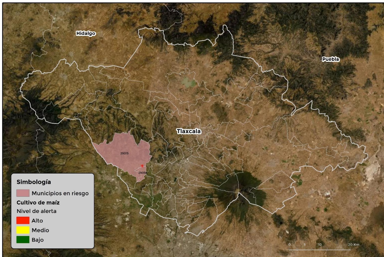
Municipios con cultivo y probable riesgo por Gusano cogollero en Tlaxcala

GEOMÁTICA-DI-SENASICA © 2021 AFC FECHA: 15-ABRIL-2021