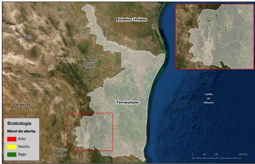
Nivel de alerta por Gusano cogollero en Tamaulipas

Se identifica que la plaga tiene bajas condiciones para comenzar su desarrollo debido a que se identificaron 3 municipios en riesgo fitosanitario bajo (Anexo 1).