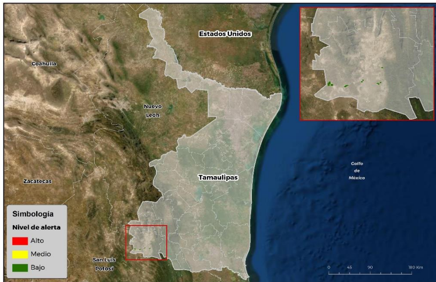
Nivel de alerta por Gusano cogollero en Tamaulipas

Se identifica que la plaga tiene bajas condiciones para comenzar su desarrollo debido a que se identificó 1 municipio en riesgo fitosanitario bajo (Anexo 1).