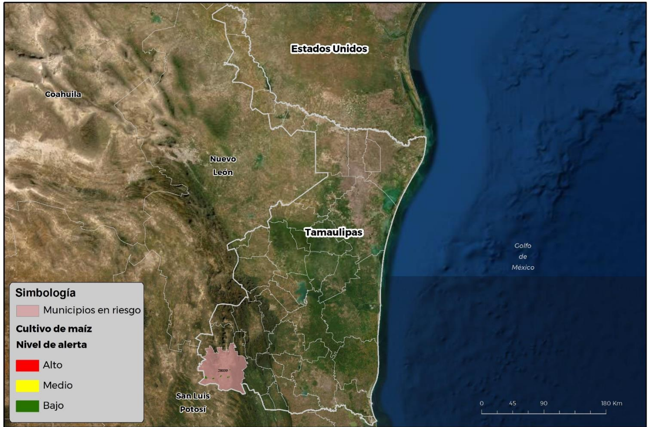
Municipios con cultivo y probable riesgo por Gusano cogollero en Tamaulipas

CROMÁTICA-DJ-SENASICA © 2021 RCP FECHA: 29/ ABRIL/ 2021