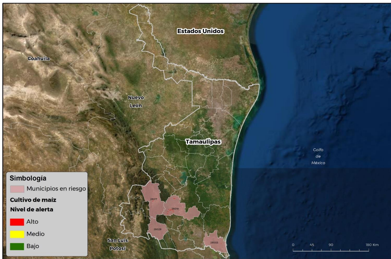
Municipios con cultivo y probable riesgo por Gusano cogollero en Tamaulipas

CROMÁTICA-03-SENASICA © 2021 RCP FECHA: 17 JUNIO 2021