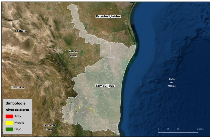
Nivel de alerta por Gusano cogollero en Tamaulipas

Se identifica que la plaga puede comenzar su desarrollo debido a que hay: