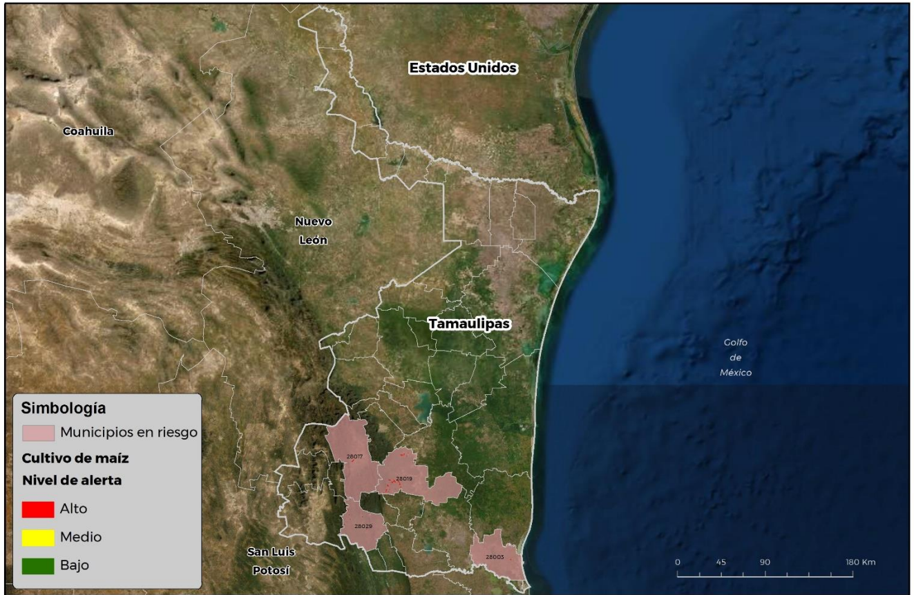
Municipios con cultivo y probable riesgo por Gusano cogollero en Tamaulipas

CROMÁTICA-03-SENASICA © 2021 RCP FECHA: 17 JUNIO 2021