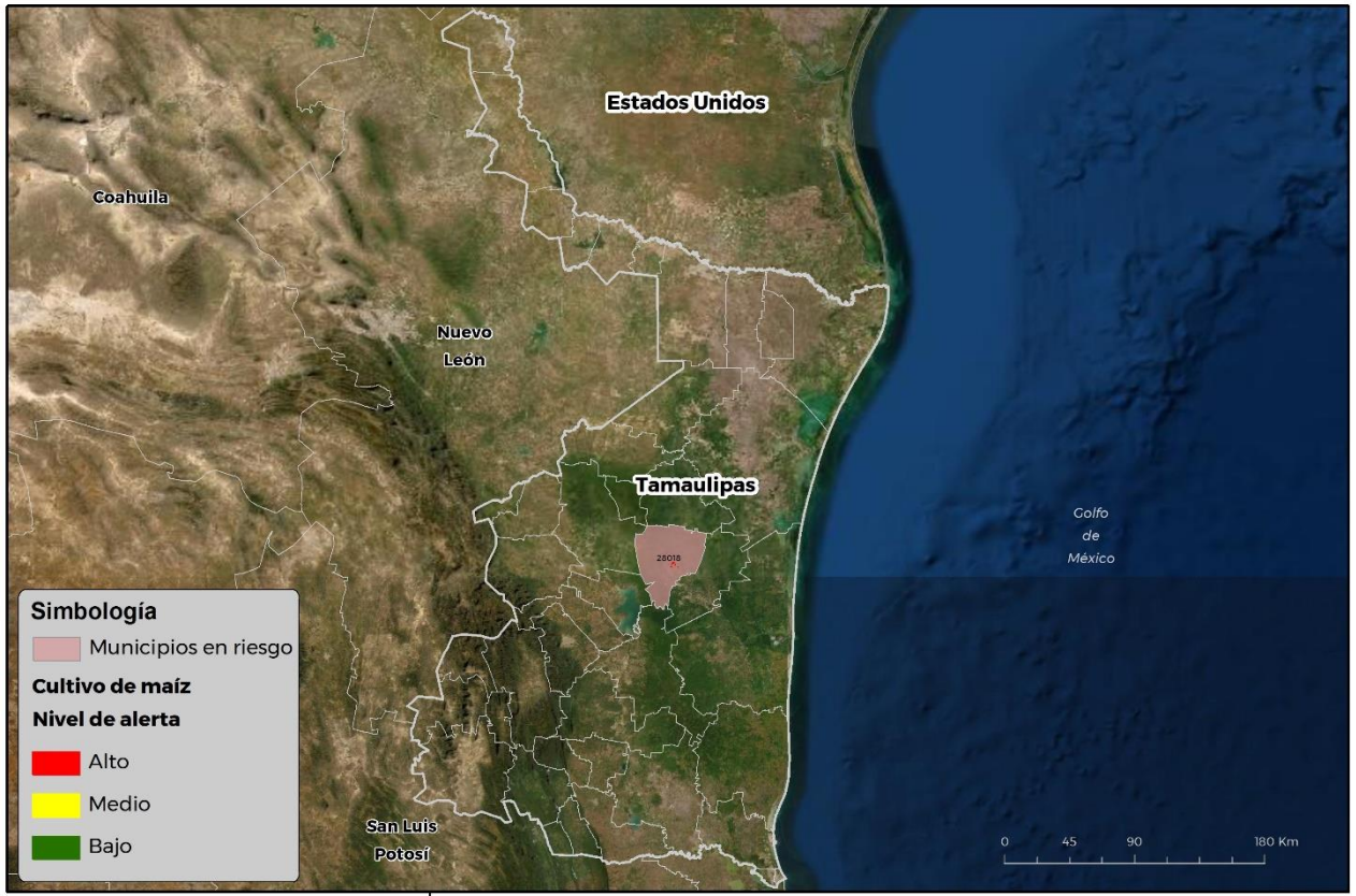
Municipios con cultivo y probable riesgo por Gusano cogollero en Tamaulipas

GEOMÁTICA-03-SENASICA © 2021 DGR FECHA: 14-ABRIL-2021