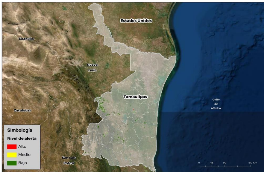
Nivel de alerta por Gusano cogollero en Tamaulipas

Se identifica que la plaga puede comenzar su desarrollo debido a que hay: