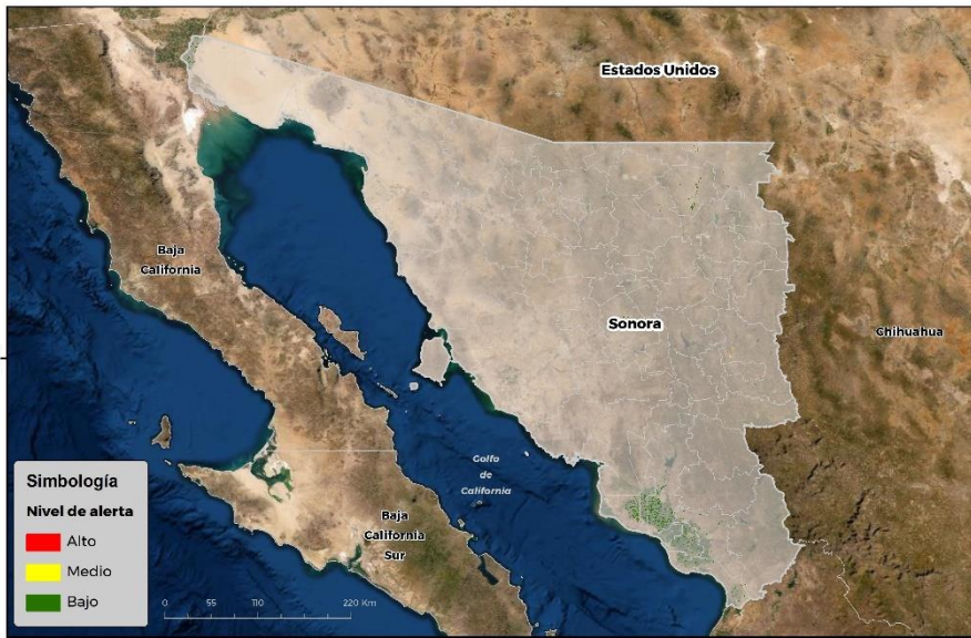
Nivel de alerta por Gusano cogollero en Sonora

Se identifica que la plaga puede comenzar su desarrollo debido a que hay: