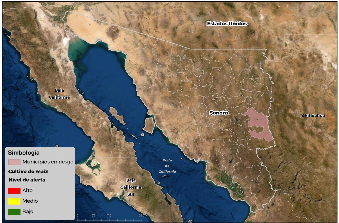
Municipios con cultivo y probable riesgo por Gusano cogollero en Sonora

GEOMATICA-D3-SENASICA © 2021 RCR FECHA: 28 ABRIL 2021