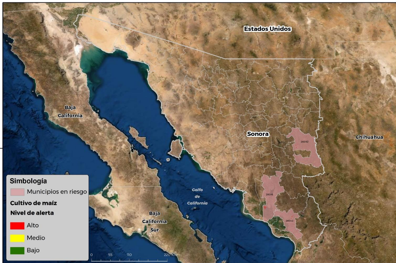
Municipios con cultivo y probable riesgo por Gusano cogollero en Sonora

CEOMATICA-03-SENASICA © 2021 RCR FECHA: 01-JUNIO-2021