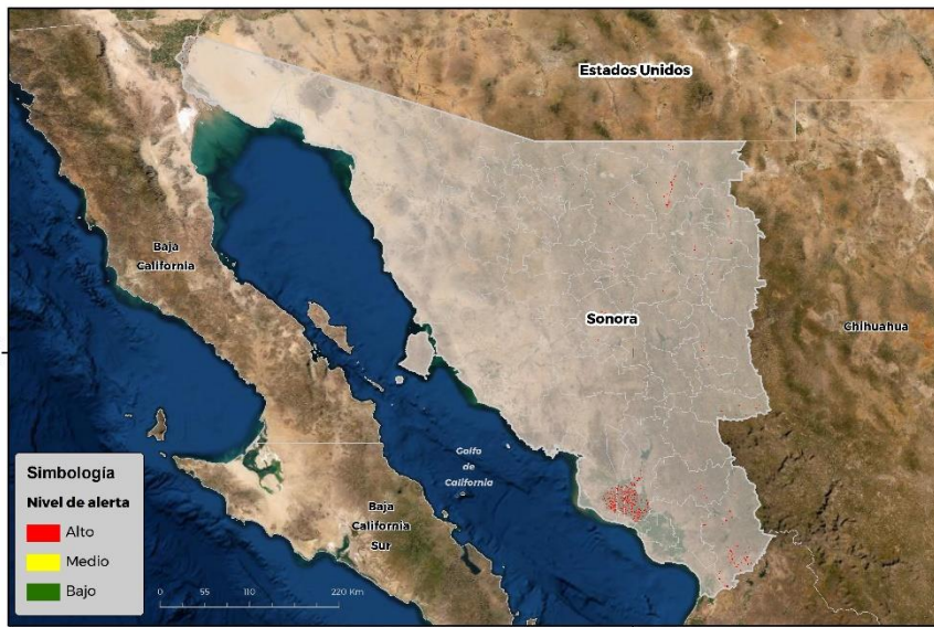
Nivel de alerta por Gusano cogollero en Sonora

Se identifica que la plaga puede comenzar su desarrollo debido a que hay: