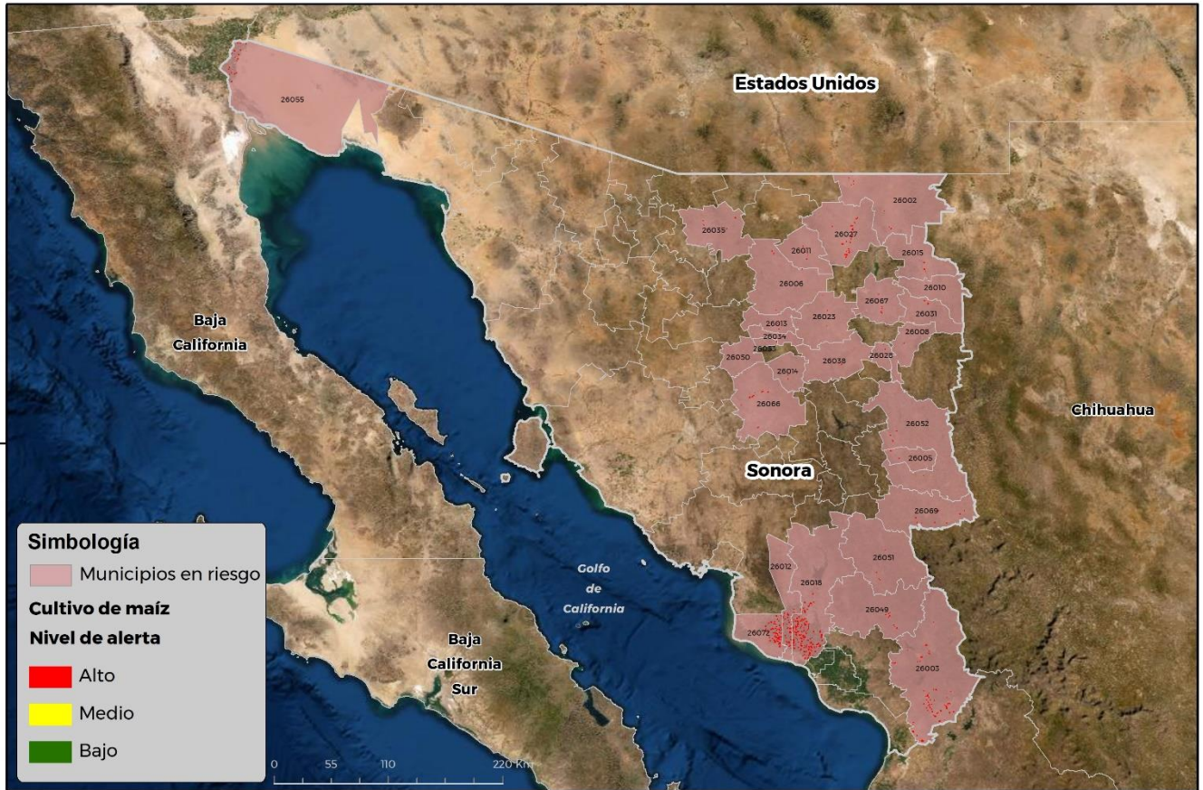
Municipios con cultivo y probable riesgo por Gusano cogollero en Sonora

CEOMATICA-D3-SENASICA © 2021 RCR FECHA: 25-AGOSTO-2021