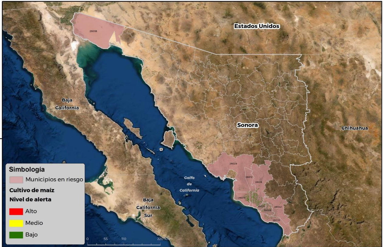
Municipios con cultivo y probable riesgo por Gusano cogollero en Sonora

GEOMÁTICA-D3-SENASICA © 2021 RGR FECHA: 14-ABRIL-2021