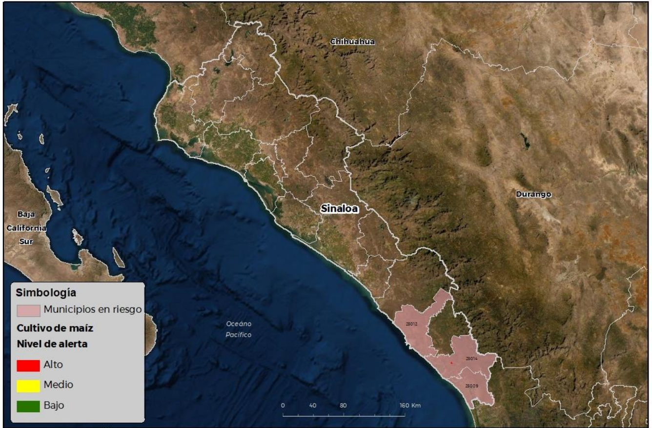
Municipios con cultivo y probable riesgo por Gusano cogollero en Sinaloa

© SENASICA-2021 SENASICA © 2021 RICR FECHA: 25-NOVIEM-2021