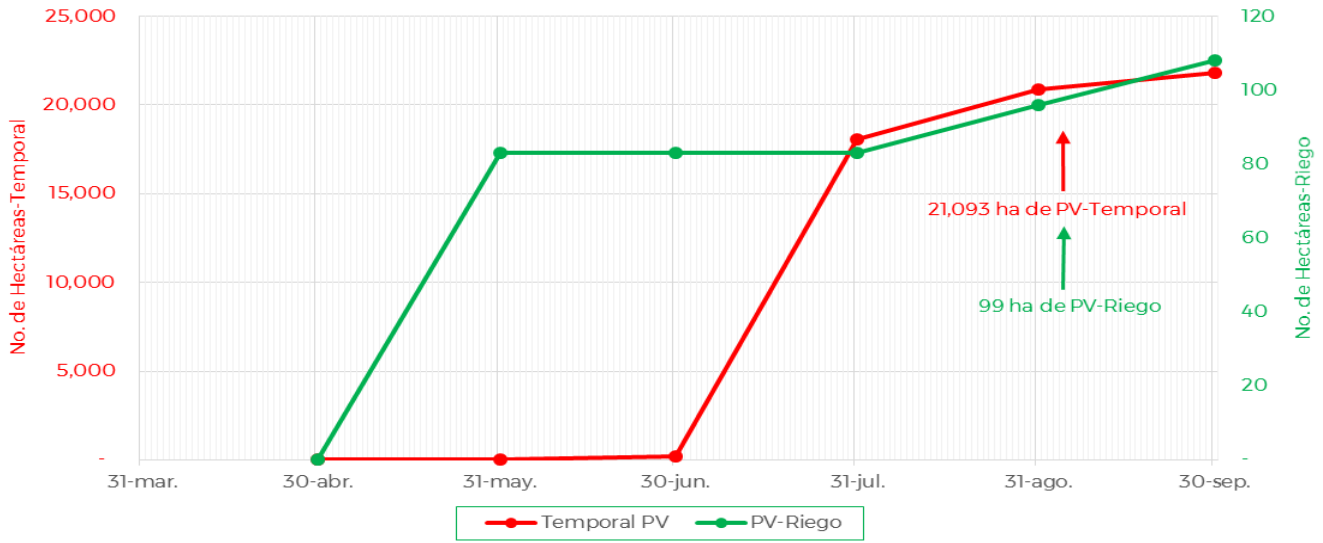
Avance de siembra de maíz en el estado de Nayarit al 06 de Septiembre de 2021 Ciclo PV

De acuerdo con los registros del SIAP, se estima un avance de siembra de la siguiente manera: