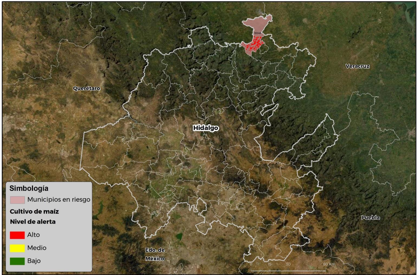
Municipios con cultivo y probable riesgo por Gusano cogollero en Hidalgo

GEOMÁTICA-DI-SENASICA © 2021 RCR FECHA: 23-ABRIL-2021