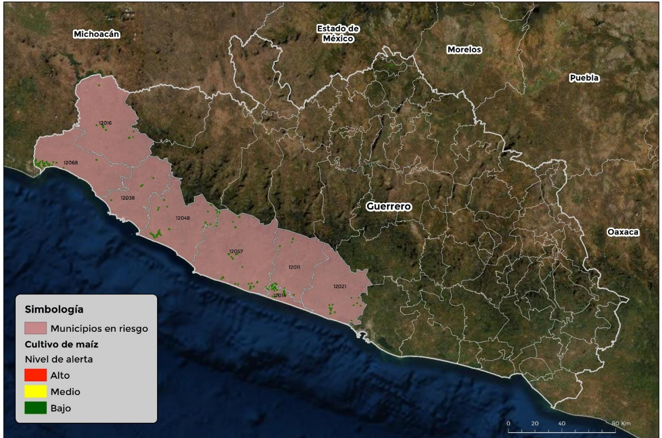
Municipios con cultivo y probable riesgo por Gusano cogollero en Guerrero

GEOMÁTICA: D3-SENASICA © 2021 DAHF FECHA: 18-OCTUBRE-2021