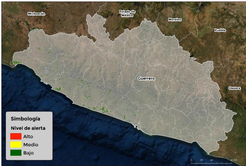
Nivel de alerta por Gusano cogollero en Guerrero

Se identifica que la plaga tiene bajas condiciones para comenzar su desarrollo debido a que se identificaron 9 municipios en riesgo fitosanitario bajo (Anexo 1).