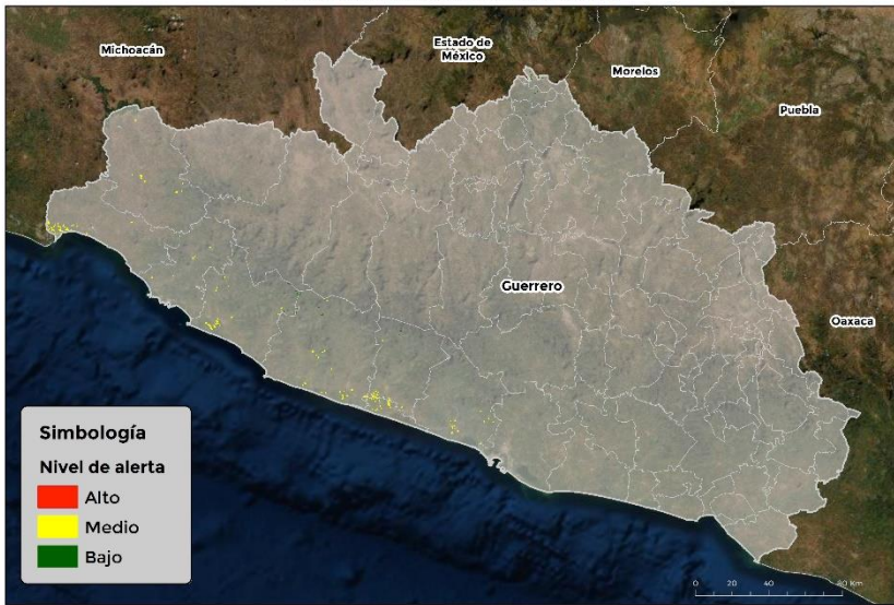
Nivel de alerta por Gusano cogollero en Guerrero

Se identifica que la plaga tiene bajas condiciones para comenzar su desarrollo debido a que se identificaron 11 municipios en riesgo fitosanitario medio y bajo (Anexo 1).