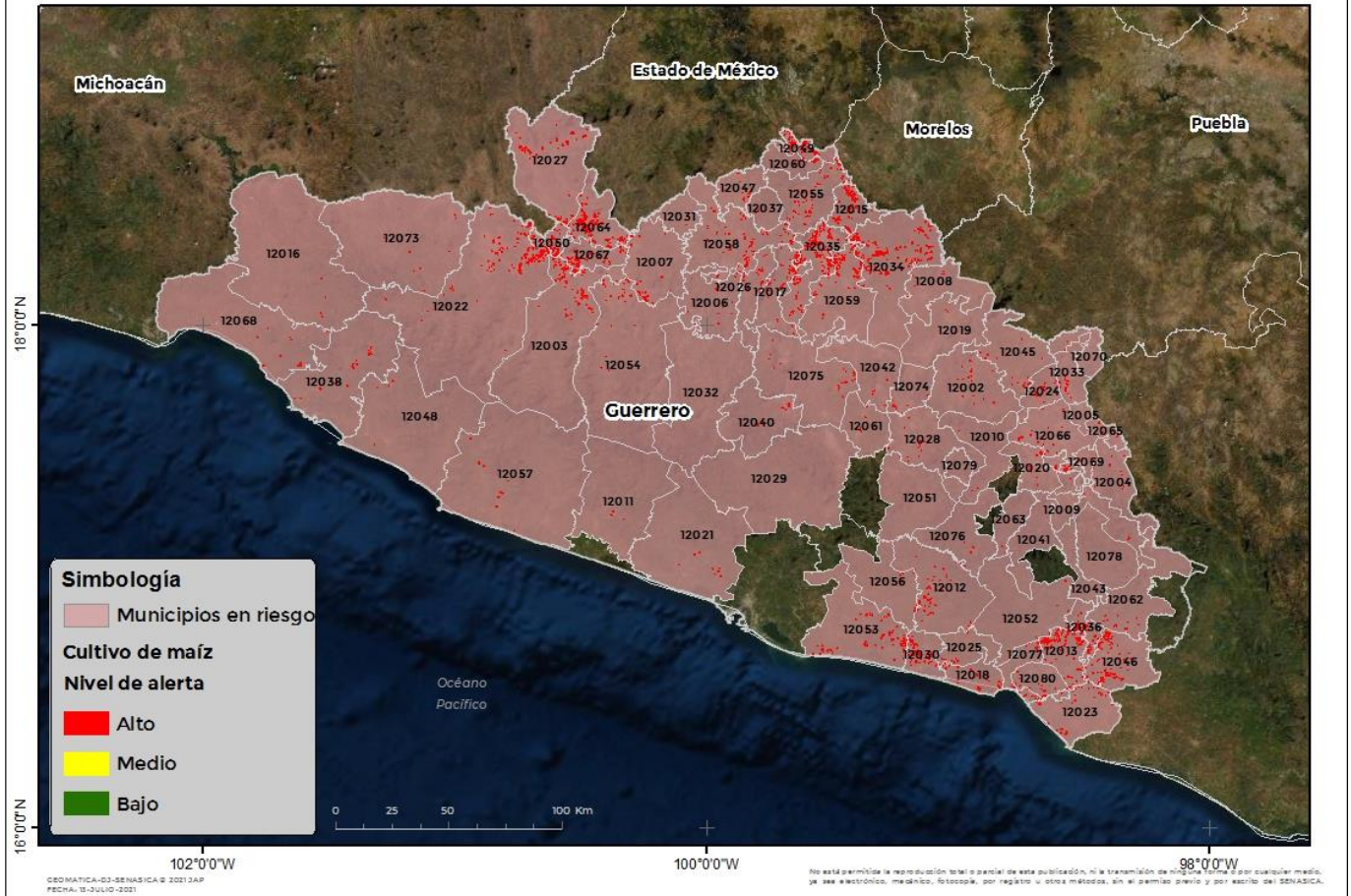
Municipios con cultivo y probable riesgo por Gusano cogollero en Guerrero

Anexo 1.- Se han identificado 74 municipios con alto riesgo y presencia del cultivo para el desarrollo de Gusano cogollero, mismos que en caso de presentarse la plaga estarías en riesgo.