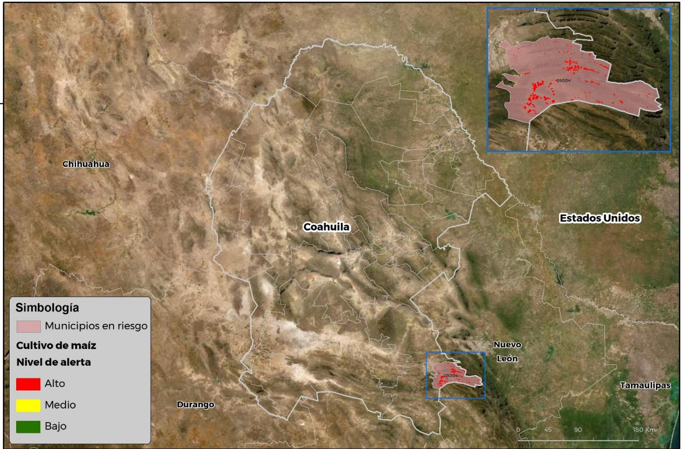
Municipios con cultivo y probable riesgo por Gusano cogollero en Coahuila

CEOMATICA-D3-SENASICA © 2021 RCR FECHA: 24-AGOSTO-2021