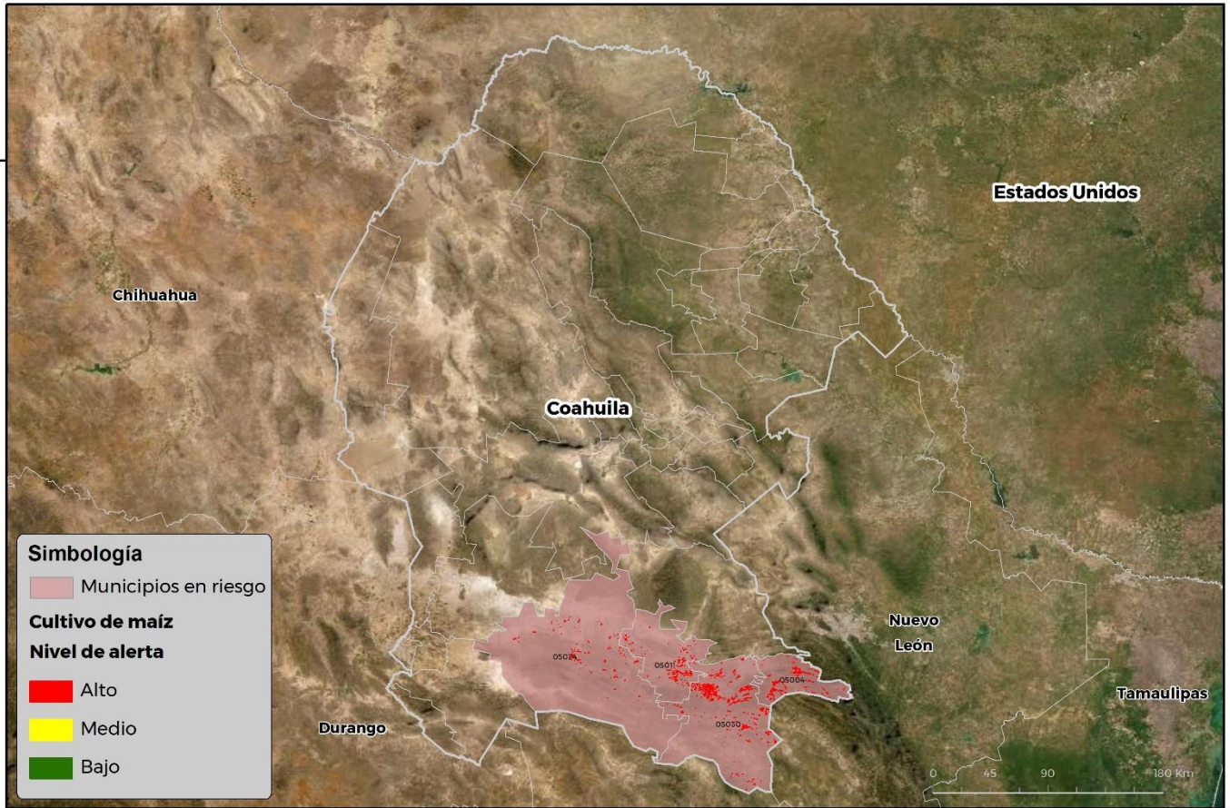
Municipios con cultivo y probable riesgo por Gusano cogollero en Coahuila

GEOMATICA-D3-SENASICA © 2021 RCP FECHA: 11-AGOSTO-2021