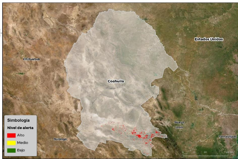
Nivel de alerta por Gusano cogollero en Coahuila

Se identifica que la plaga puede comenzar su desarrollo debido a que hay: