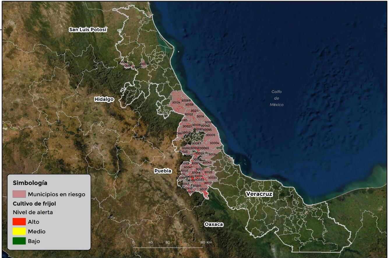
Municipios con cultivo y probable riesgo por Conchuela del frijol en Veracruz

GEOMATICA-D3-SENASICA © 2021 D.A.H.F. FECHA: 01-JULIO-2021