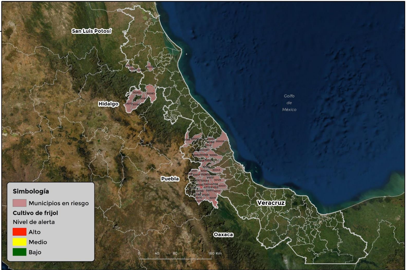
Municipios con cultivo y probable riesgo por Conchuela de frijol en Veracruz

GEOMÁTICA-DJ-SENASICA © 2021 DAHF FECHA: 28-MAYO-2021