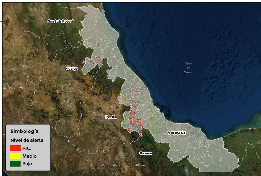
Nivel de alerta por Conchuela de frijol en Veracruz

Se identifica que la plaga puede comenzar su desarrollo debido a que hay: