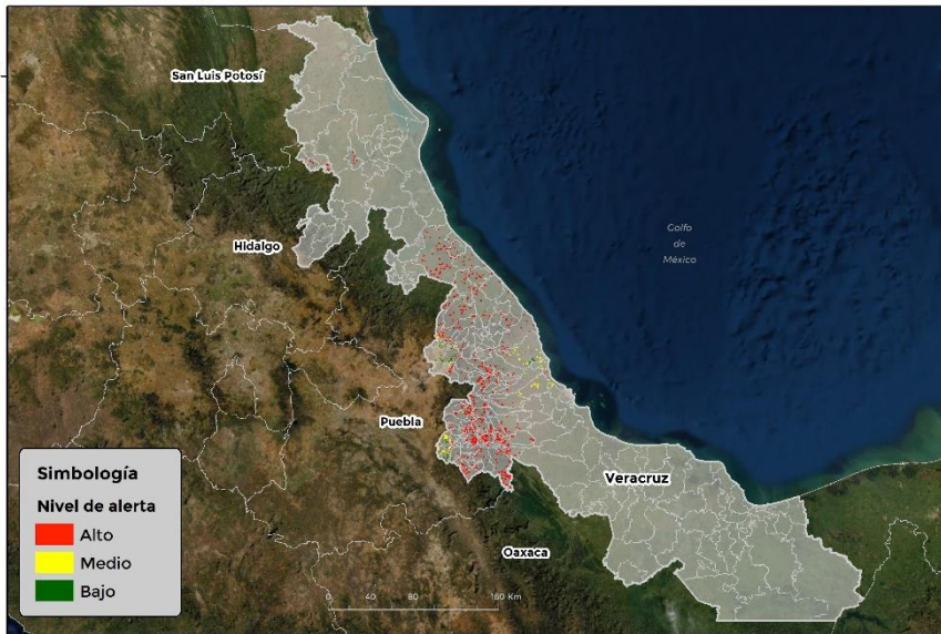
Nivel de alerta por Conchuela del frijol en Veracruz

Se identifica que la plaga puede comenzar su desarrollo debido a que hay: