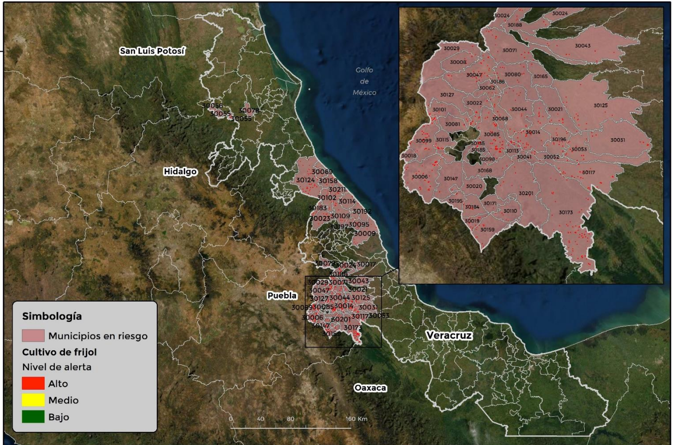
Municipios con cultivo y probable riesgo por Conchuela del frijol en Veracruz

GEOMÁTICA-D3-SENASICA © 2021 DAHF FECHA: 16-AGOSTO-2021