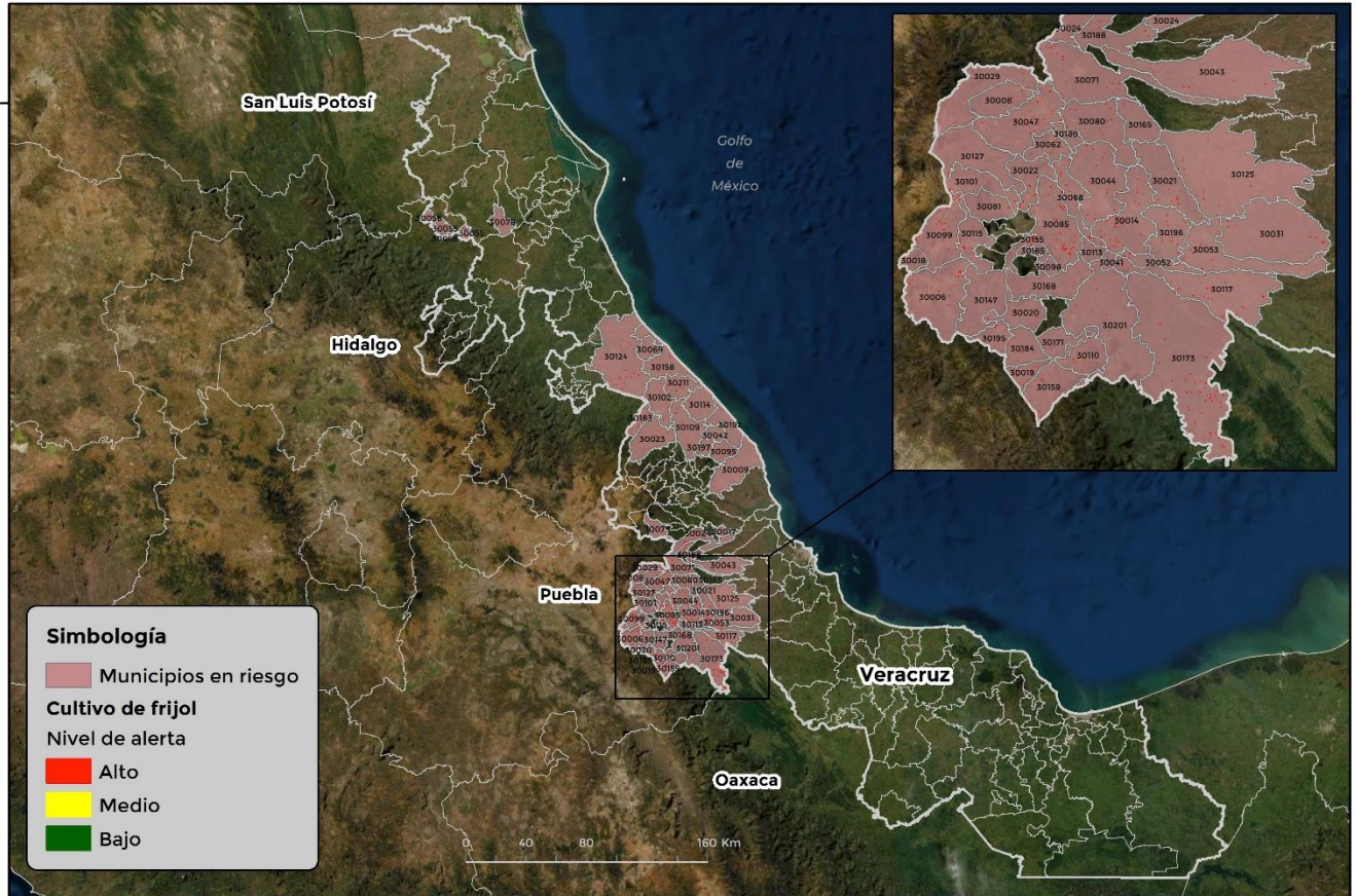
Municipios con cultivo y probable riesgo por Conchuela del frijol en Veracruz

GEOMÁTICA-DJ-SENASICA © 2021 DARR FECHA: 01-AGOSTO-2021