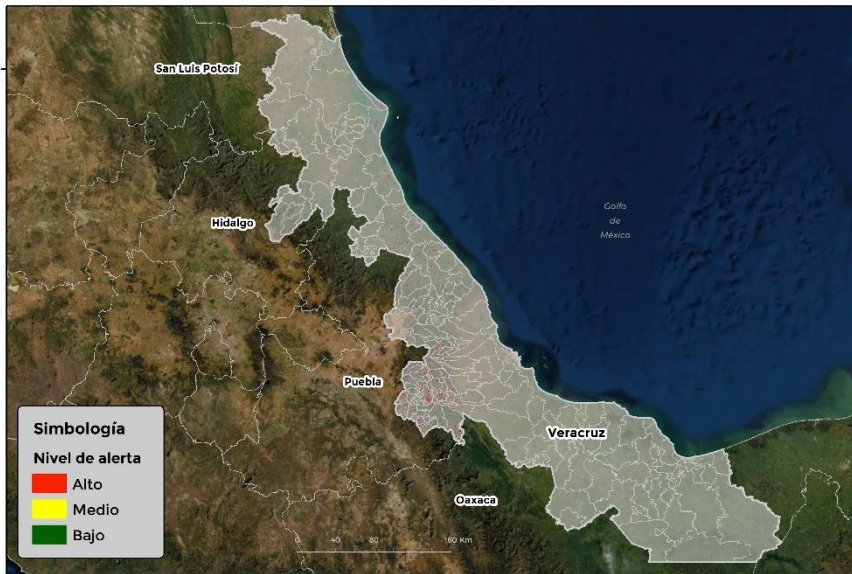
Nivel de alerta por Conchuela del frijol en Veracruz

Se identifica que la plaga puede comenzar su desarrollo debido a que hay: