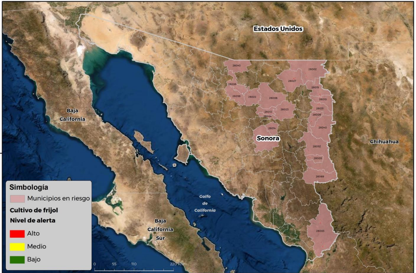
Municipios con cultivo y probable riesgo por Conchuela del frijol en Sonora

GEOMÁTICA-D3-SENASICA © 2021 RGR FECHA: 20-AGOSTO-2021