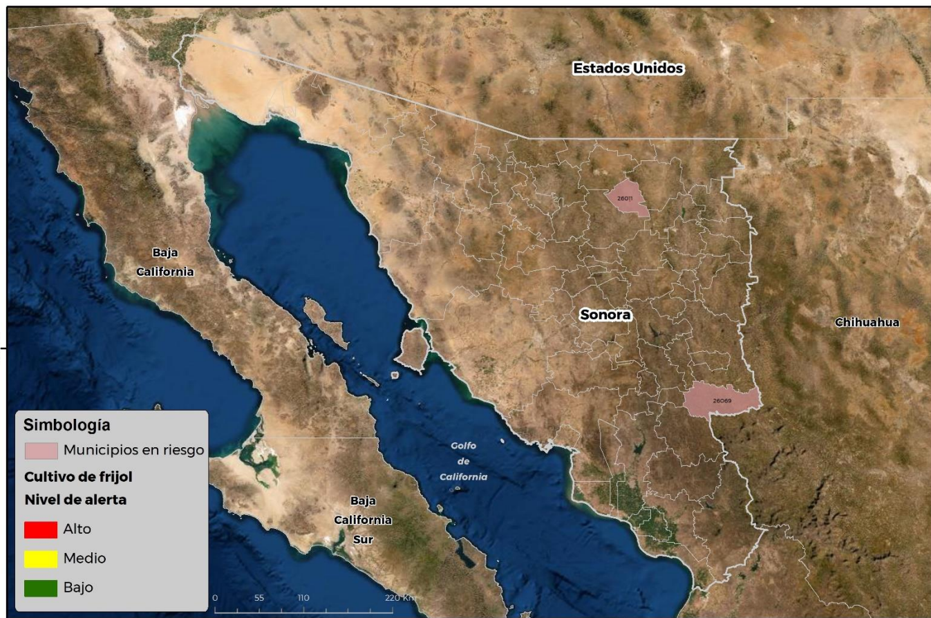
Municipios con cultivo y probable riesgo por Conchuela del frijol en Sonora

GEOMÁTICA-D3-SENASICA © 2021 RCR FECHA: 07-JUNIO-2021