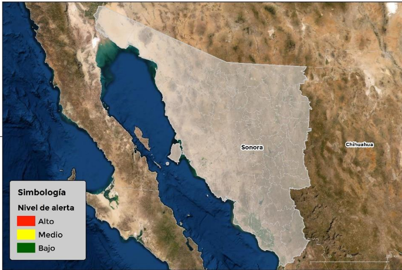
Nivel de alerta por Conchuela del frijol en Sonora

Se identifica que la plaga puede comenzar su desarrollo debido a que hay: